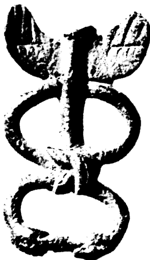
7. Caduceo, museo de Saint-Germain-en-Laye

la libre elección y la coacción y, por otro, entre Ananke y Elpís, entre el aprisionamiento en los límites y el vuelo hacia el infinito.