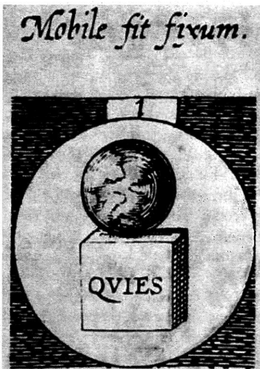
5. O. Vaenius, Emblemata , 1624

trata de una «buena fortuna». Como si ella hubiera venido a inmovilizarse sobre el cubo que puede representar la virtud, en todo caso la estabilidad.